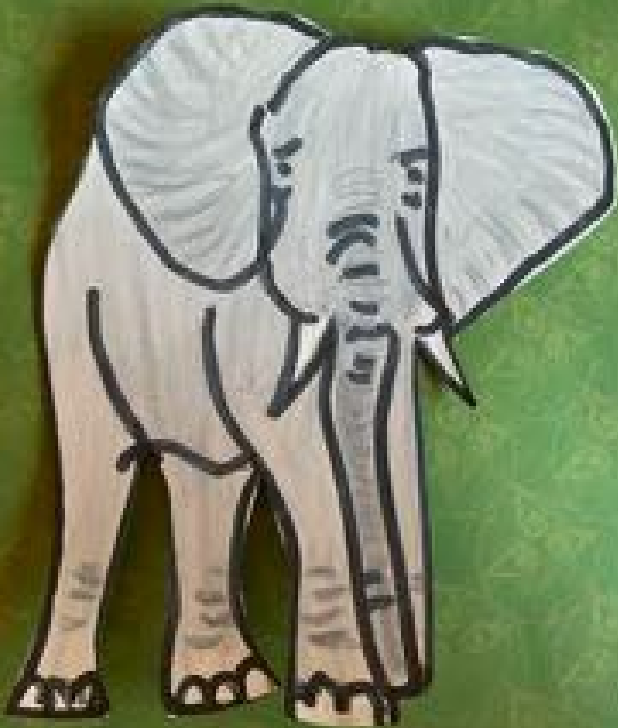
ລວມທັງຊ້າງທີ່ເປັນສວນໜຶ່ງຂອງພື້ນຫຼັງປ່າ ແລະ ເປັນບັນດາພື້ນຫຼັງຂອງປ່າໄດໂອລາມາອີກດ້ວຍ